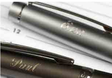
パーソナライゼーション