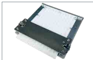
鉛筆用治具 : 丸・三角・六角鉛筆に対応