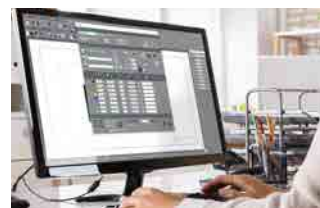
ソフト : ディスカバリー箔押し製本仕様 他