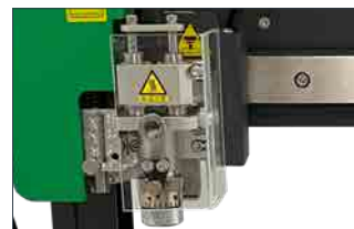
スピンドルセット