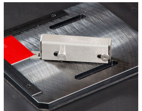
マグネティックプレートホルダー