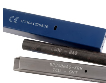
塗装、コーティング、原材料