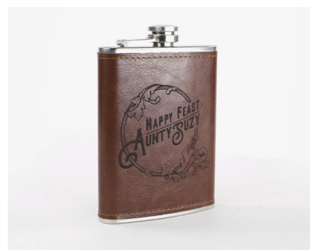
トレーサビリティ