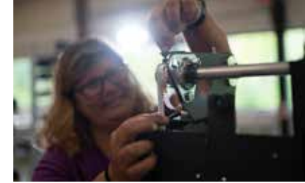
メンテナンス（修理）