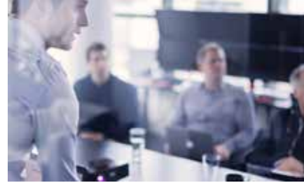
トレーニング（納品講習）

世界50カ国以上ある支社には、彫刻・マーキングのプロが常駐していますので、マシン設置やトレーニングなど、お客様のアプリケーションを達成するための細やかなサポートが可能です。