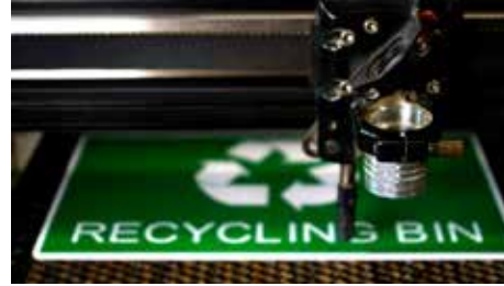
レーザー用彫刻材料

グラボテックの彫刻材料は、美しい彫刻・カットができるように特別に開発されています。 《表彫り》《裏彫り》彫刻、レーザーマーキング、カッター彫刻だけでなく、UVプリントにも対応しています。 プラスチック・金属・二層板などの種類と色・厚み・仕上げからお好みのものをお選びください。